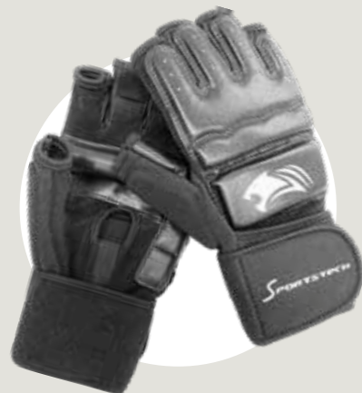
MMA HANDSCHUHE / MMA GLOVES